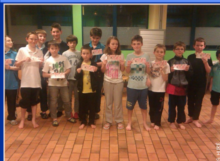
Les parents trouvent les réponses des jeux, les enfants gagnent les places