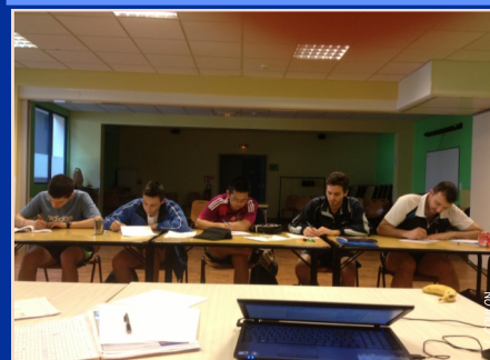
Pour bien entraîner, il faut bien préparer sa séance !