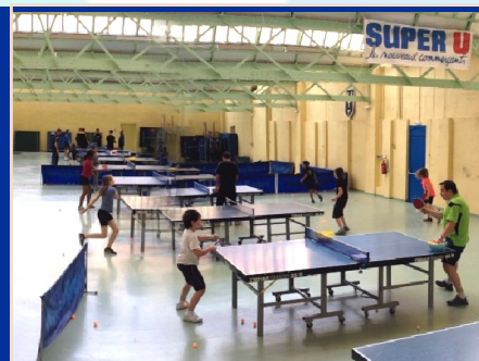
40 enfants de 7 à 13 ans ont rodé les 35 tables du CRJS de Salbris