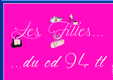
Un blog pour les filles et réservé aux filles, ça c'est de la com' !