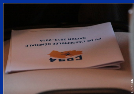
Un accueil de grande classe en plein milieu du golf d'Ormesson-sur-Marne

Lucie COULON - CTD - CD 94 tennis de table