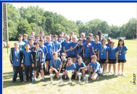
Une délégation radieuse après sa victoire au challenge général