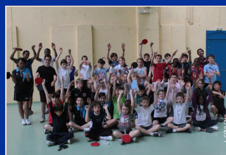
La bonne ambiance et la convivialité ont été de mise jusqu'à la dernière minute !