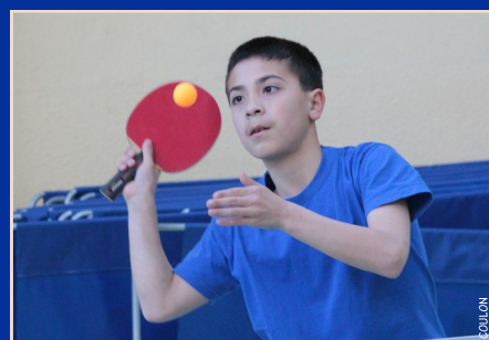
Une grande place est donnée au travail du service, premier geste en match !